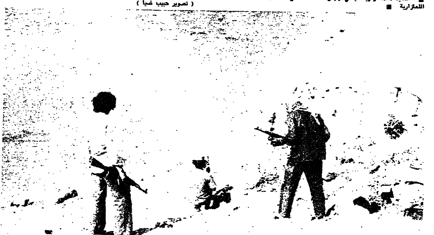
مسلحون يتركزون على الشاطئ في عين المرسة